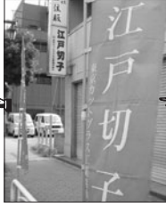
④東京カットグラス工業協同組合