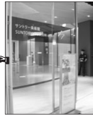
⑨サントリー美術館