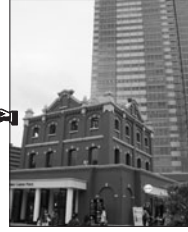
①恵比寿麦酒記念館